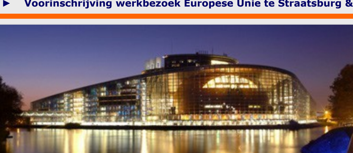
Het Europees Parlement te Straatsburg

De VVD-Afdeling Brunssum/Onderbanken nodigt u uit voor een tweedaags werkbezoek aan de Europese Unie te Straatsburg & Luxemburg op